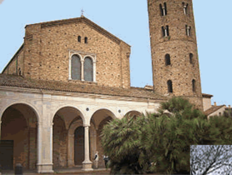
Basilica di Sant'Apollinare Nuovo