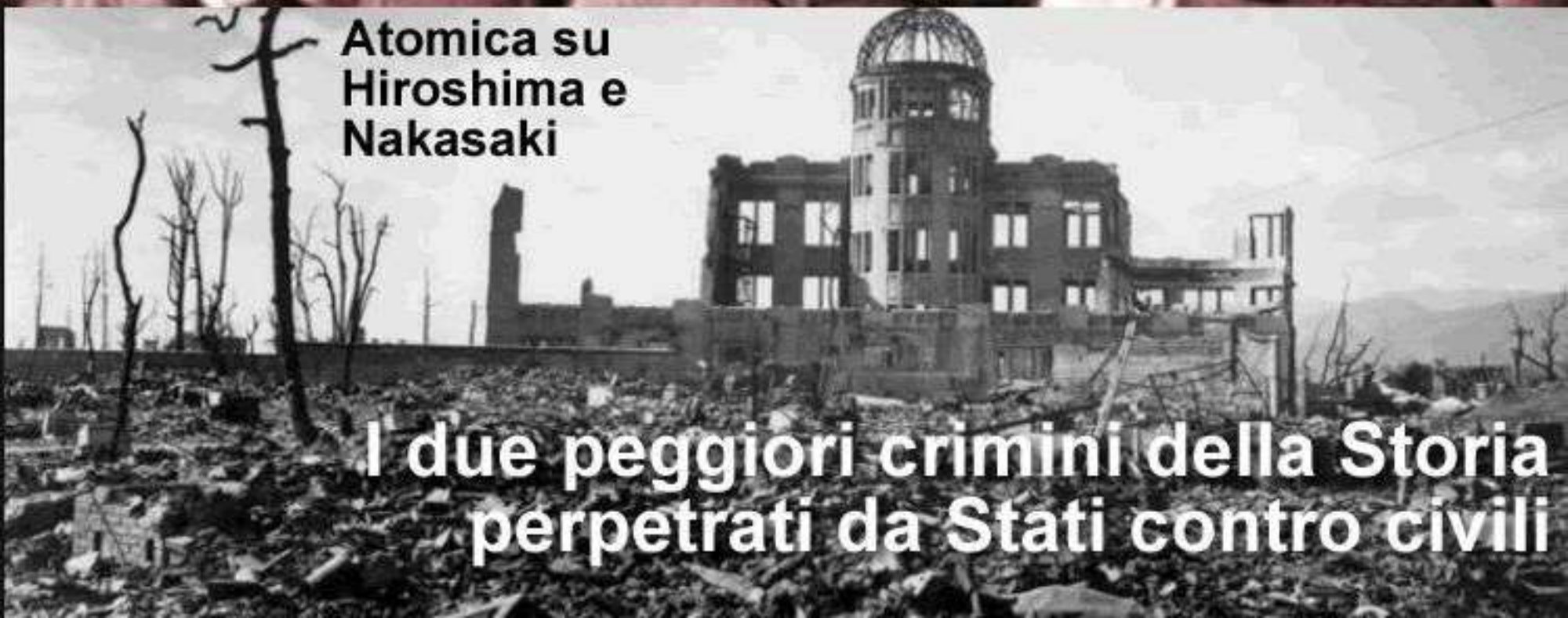
Atomica su Hiroshima e Nakasaki

I due peggiori crimini della Storia perpetrati da Stati contro civili