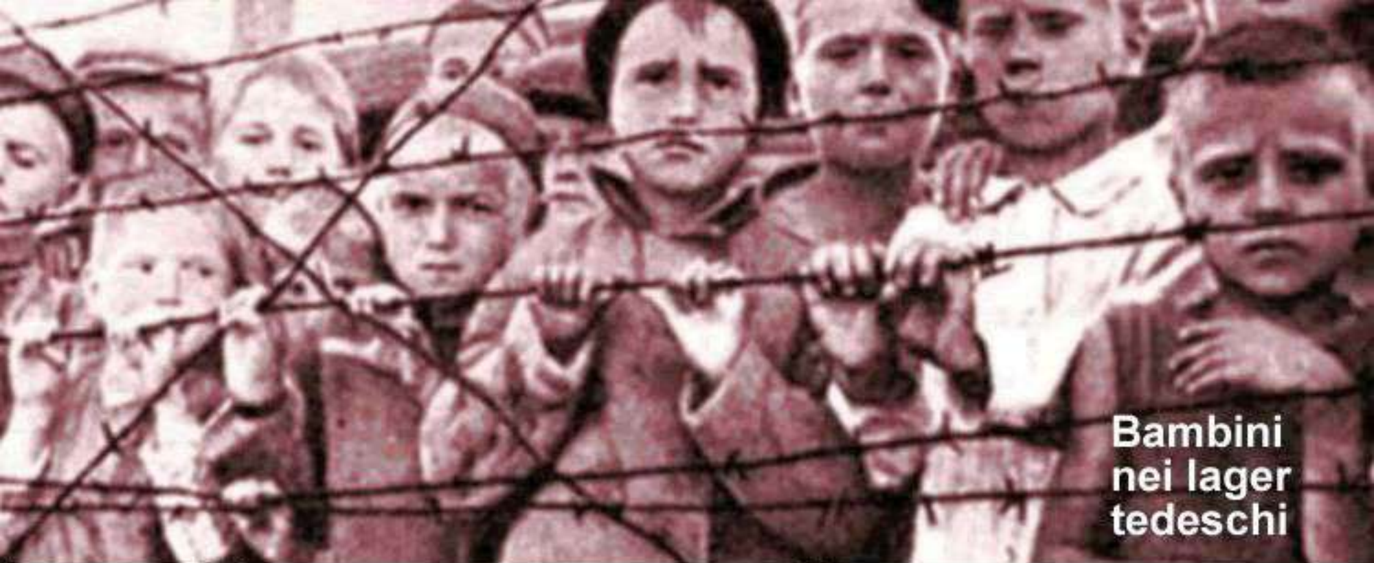
Bambini nei lager tedeschi