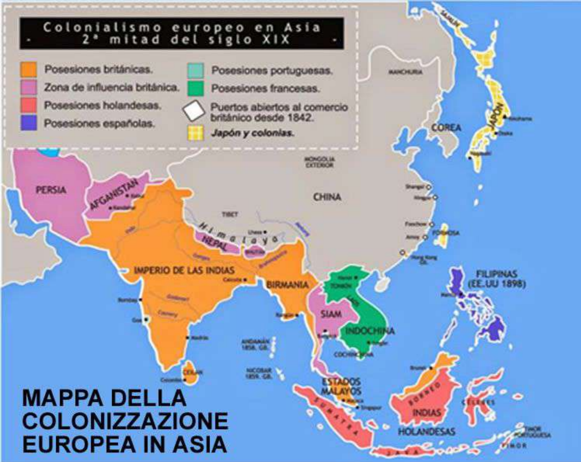
MAPPA DELLA COLONIZZAZIONE EUROPEA IN ASIA