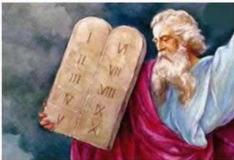
Decalogo di Mosè (solo per vecchi)