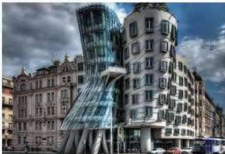
Decalogo dell'etica post-moderna